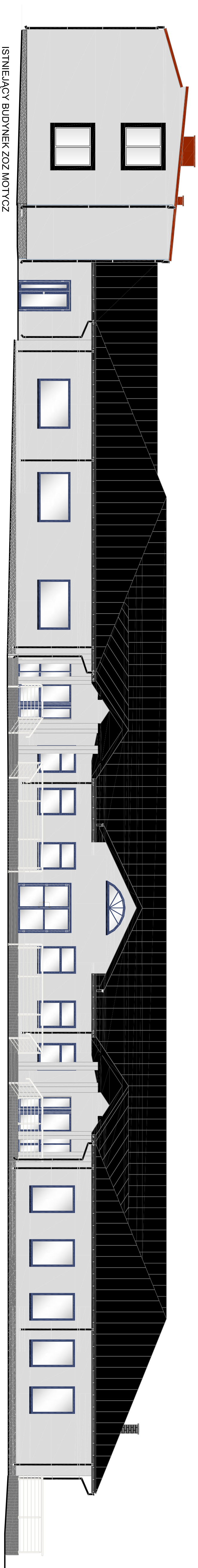
ISTNIEJĄCY BUDYNEK ZOZ MOTYCZ